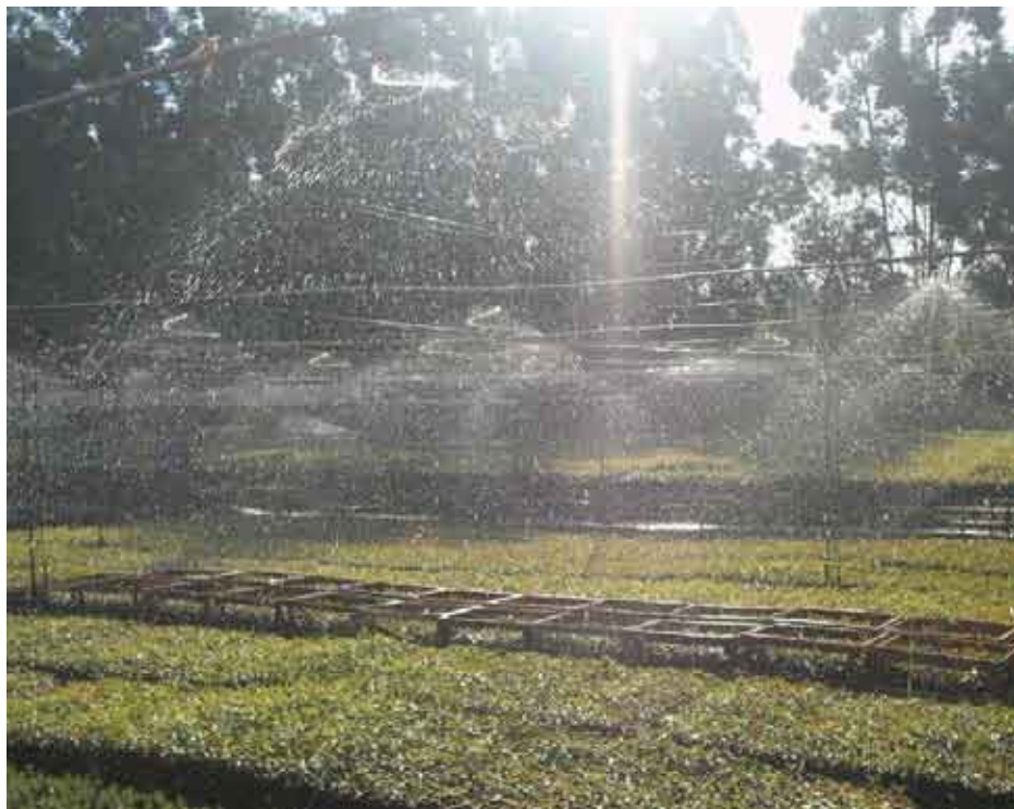
Riego por aspersión de plantines de eucaliptos, Vivero de la Cooperativa Colonias Unidas