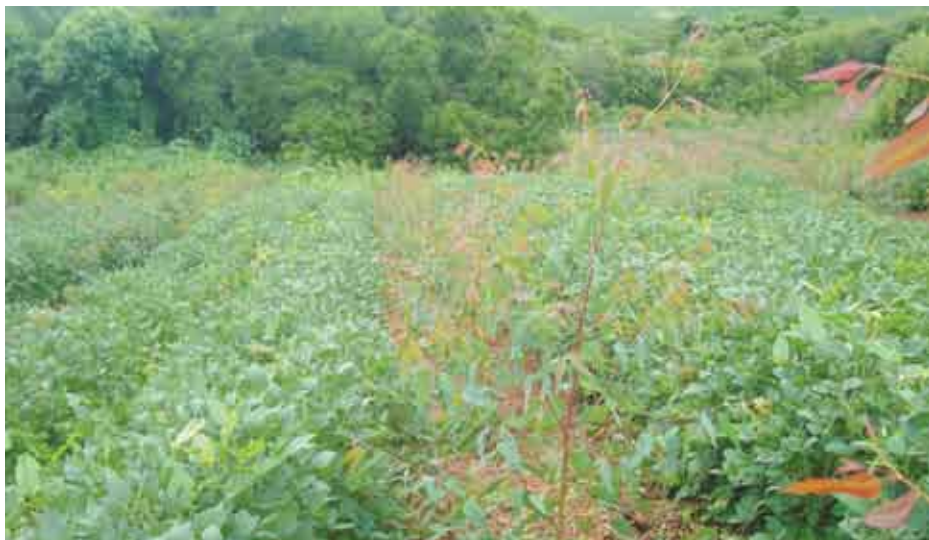
Eucaliptos asociado con soja

pu/PTI, Rediex y Gobierno Central. Todas estas acciones son también para el cumplimiento de la legislación ambiental.