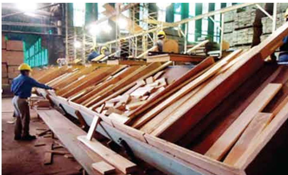
Gira de cooperativas a Misiones - Argentina