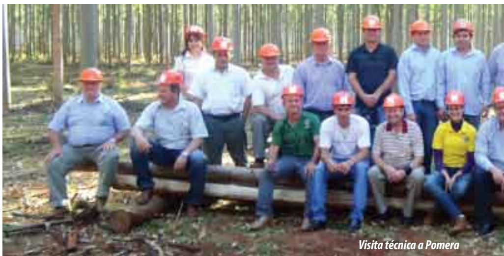
Visita técnica a Pomera

en diferentes ámbitos, entre ellos el ambiental, identificándose la superficie de reforestación realizada y la superficie por reforestar, a partir de allí se vio con gran optimismo que es posible proponer un sistema de reforestación sustentable que permita cumplir con el marco legal vigente y que también sea un rubro alternativo de producción. A partir de allí fue elaborado un proyecto denominado Gestión