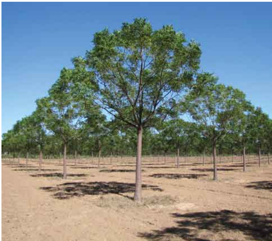
Parcela de Reforestación con Paraíso Común en el Chaco.