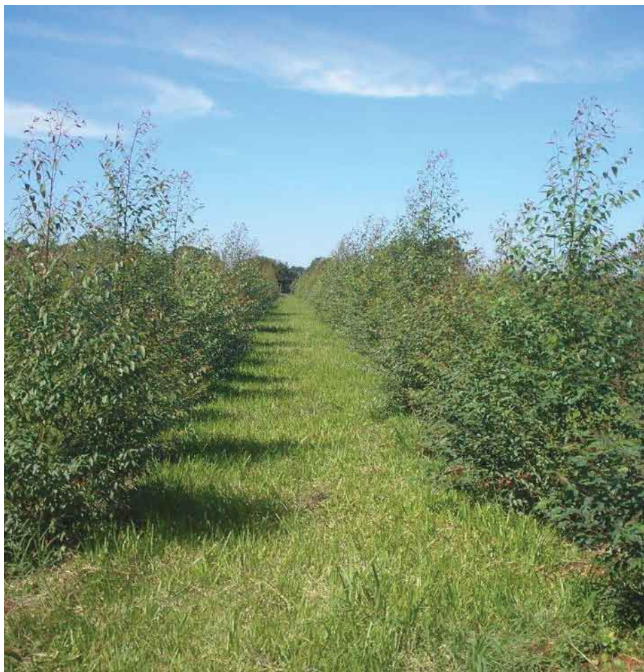
Parcela de ensayo, comparación de clon de eucalipto vs. plantas de semillas certificadas

Otra de los aspectos resaltantes es que las tierras con mejores características edáficas son destinadas a la agricultura mecanizada, mientras que en los proyectos forestales se destinan las menos aptas o degradadas.