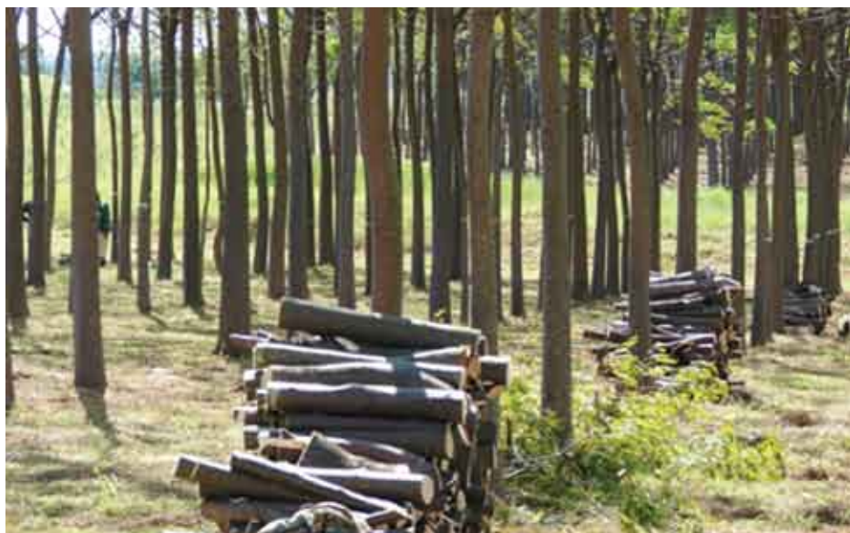
Raleo en parcela de Paraíso