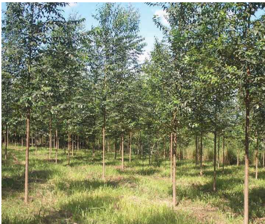
Parcela de reforestación con eucalipto, con manejo, 1ra intervención de poda

Se aprovechan las reuniones mensuales que se realizan en las sucursales para la difusión y promoción de los proyectos forestales encargados por la Cooperativa.