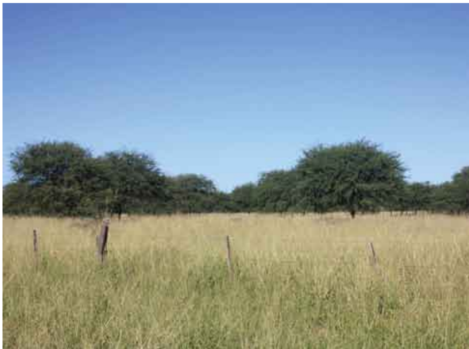
Sistema silvopastoril que se estableció hace 12 años con algarrobo mediante regeneración natural.