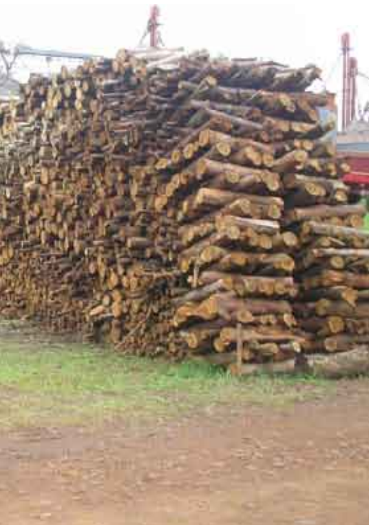
Planchada de leña en el predio de la Cooperativa Colonias Unidas proveniente de bosques implantados de Eucaliptos, destinados al sector Industrial para el secado de granos, generación de energía calórica para la Planta Láctea y secado de Yerba Mate canchada.

pinos, cedro australiano, grevilea, hovenia) también se comercializa plantas frutales como cítricos injertados (naranjas, mandarinas, pomelos, limones, kinoto), mangos injertados, Acerola, Carambola, Duraznos, Frutilla, Uva.