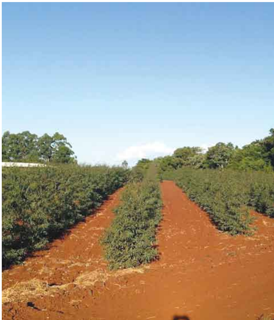
Plantación de Eucalipto

La puesta en marcha de este programa incluye: realizar reforestación con fines de protección con especies nativas y exóticas con fines comerciales, implementar el sistema silvopastoril. También la socialización del proyecto en diversas instancias: municipalidad local, Itai-