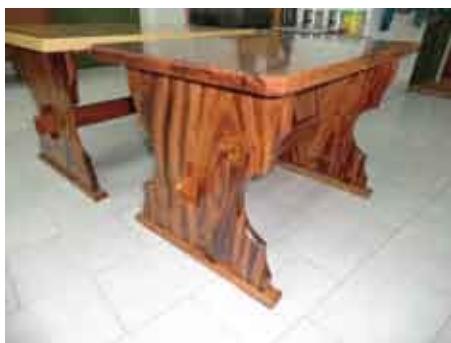
Muebles del Centro Tecnológico de la Madera