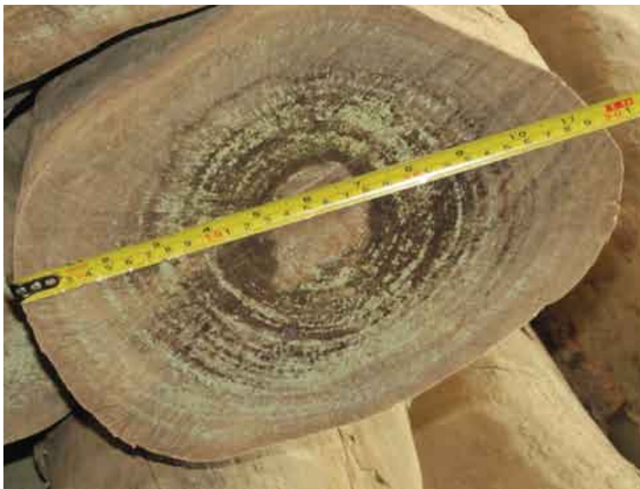
Madera de Palosanto

dio, en donde se trabajó con tecnología novedosa, tal como el secado de la madera y la impregnación. A fines del 2011 y a comienzos del 2012 se formó un equipo de investigación entre