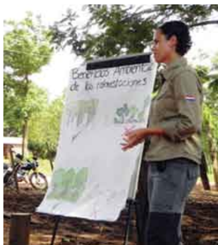
Jornada de Capacitación Forestal