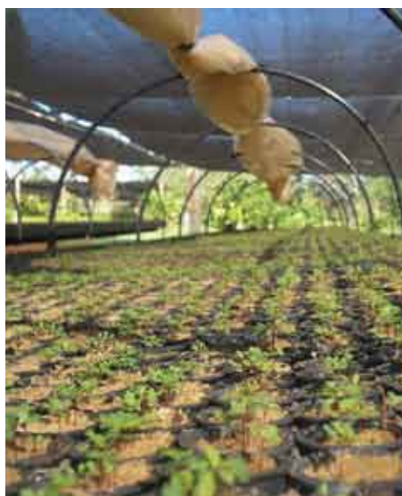
Germinación de semillas de eucaliptos en tubetes, Vivero de la Cooperativa Colonias Unidas

Dentro del Programa de Reforestación se cuenta con un vivero frutiforestal propio, con capacidad de producción entre 500.000 a 600.000 plantas por año, ofreciendo alternativas en el momento de la elección de la especie forestal con los que el asociado considere apropiado reforestar o plantar.