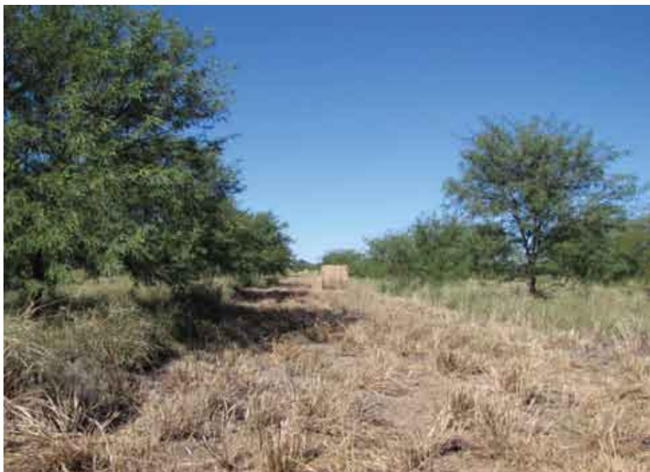
Sistema silvopastoril que se estableció hace 2 años con algarrobo mediante plantación