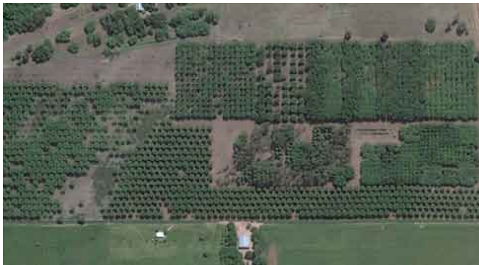
Ensayo de variedades forestales en suelos arenosos – Campo Aroma.

Cronología de la sección forestal de la cooperativa.