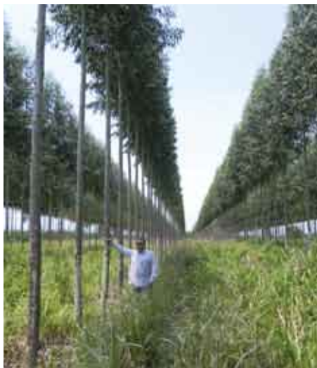
Parcela de Eucalypto grandis

No existen líneas de financiamiento específicas para la producción forestal, todo lo que