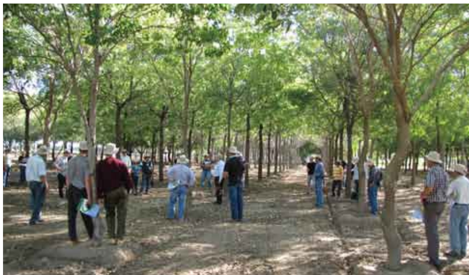
Visita en un día de campo Forestal en Parcela de Ensayo de especies, Campo Aroma, Cooperativa Fernheim.